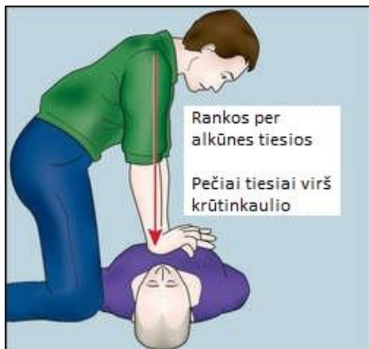
ATLIKITE 30 KRŪTINĖS PASPAUDIMŲ

5. Nedelsiant pradėkite krūtinės paspaudimus – įpūtimus santykiu 30:2