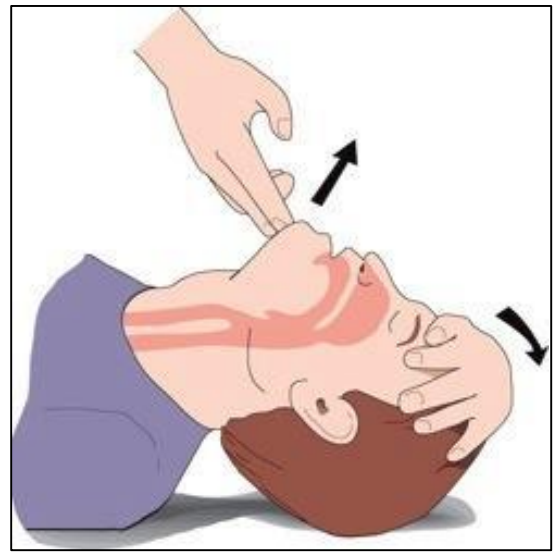
ATVERKITE KVĖPAVIMO TAKUS

3. Apžiūrėkite, ar nematyti svetimkūnio. Bandyti šalinti svetimkūnį pirštu galima tik jį matant.