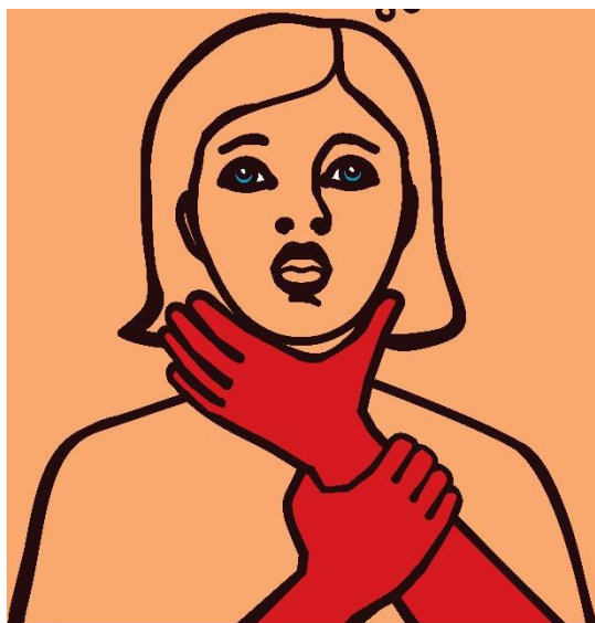
TARPTAUTINIS UŽSPRINGIMO ŽENKLAS